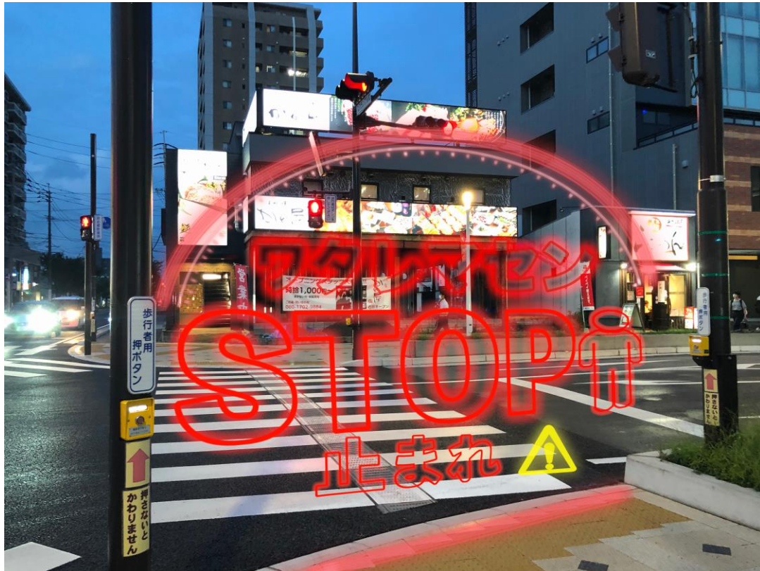
①交差点における 歩行者のため のサイン計画